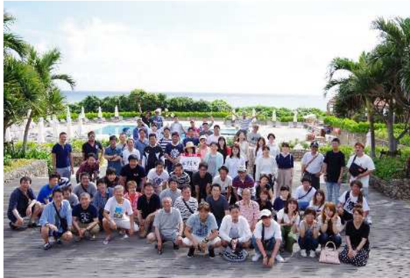
社員旅行では日本全国の社員(148名)が 一度に集まります！

会社でお花見(BBQ大会)や忘年会、 年に一度、社員旅行(海外もあり)があり一致団結したアットホームな会社です。